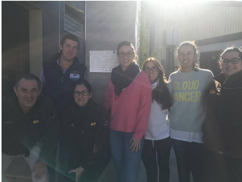
Figure 5. Notice board at Galpagro