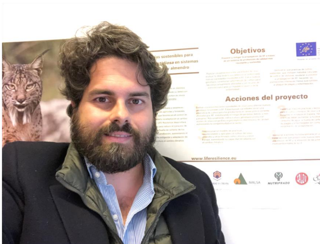
Figure 11. Notice board at ASAJA Brussels