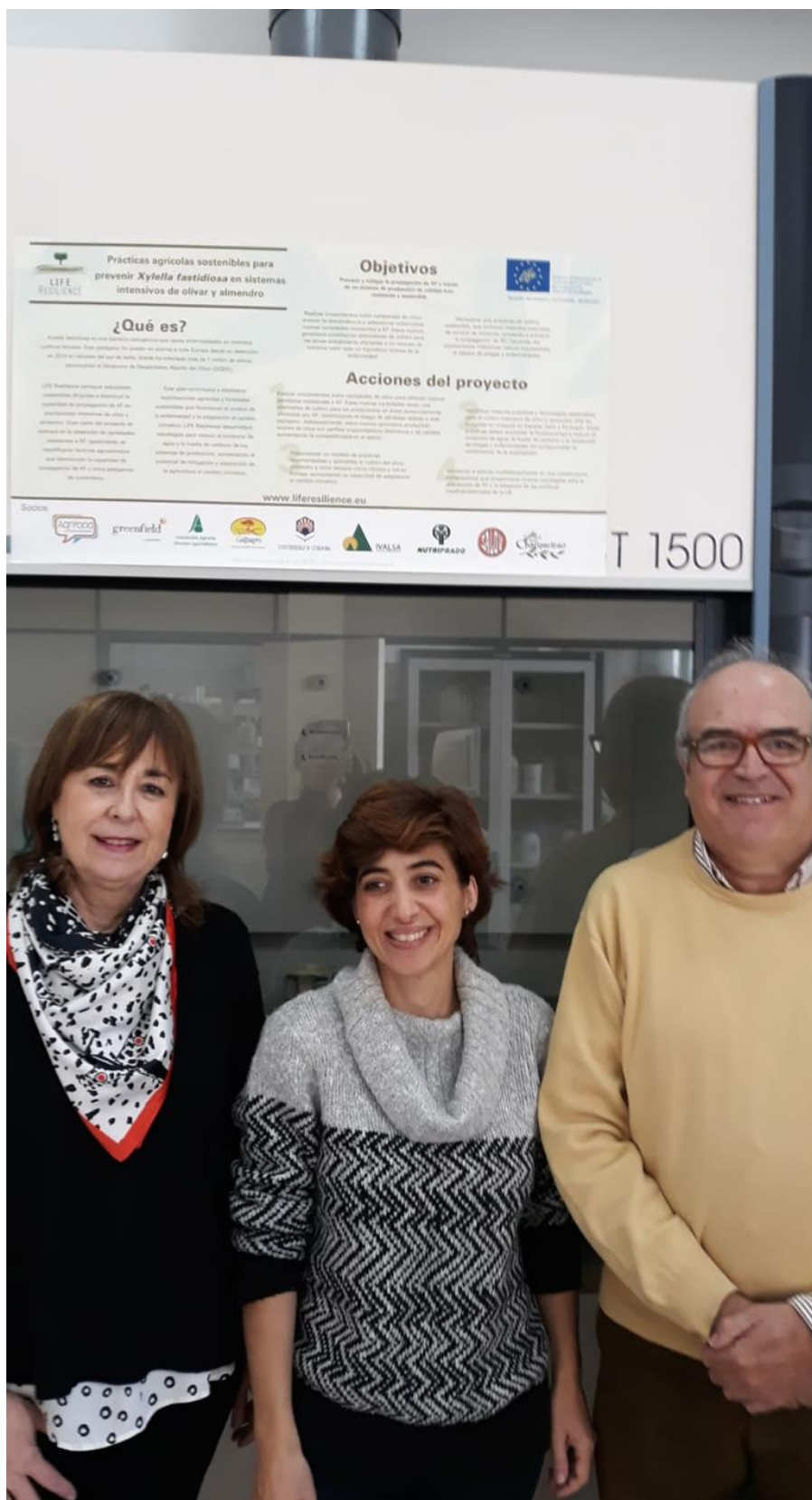
Figure 7. Notice board at UCO