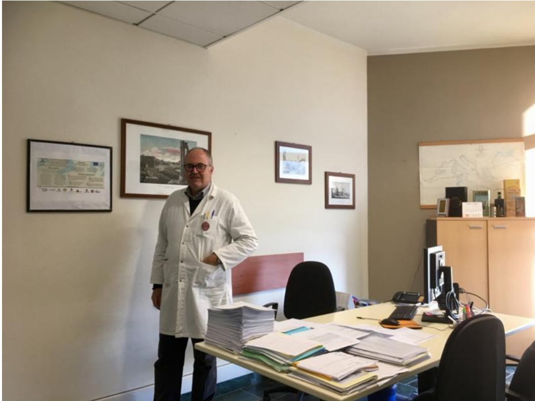
Figure 8. Notice board at Salov