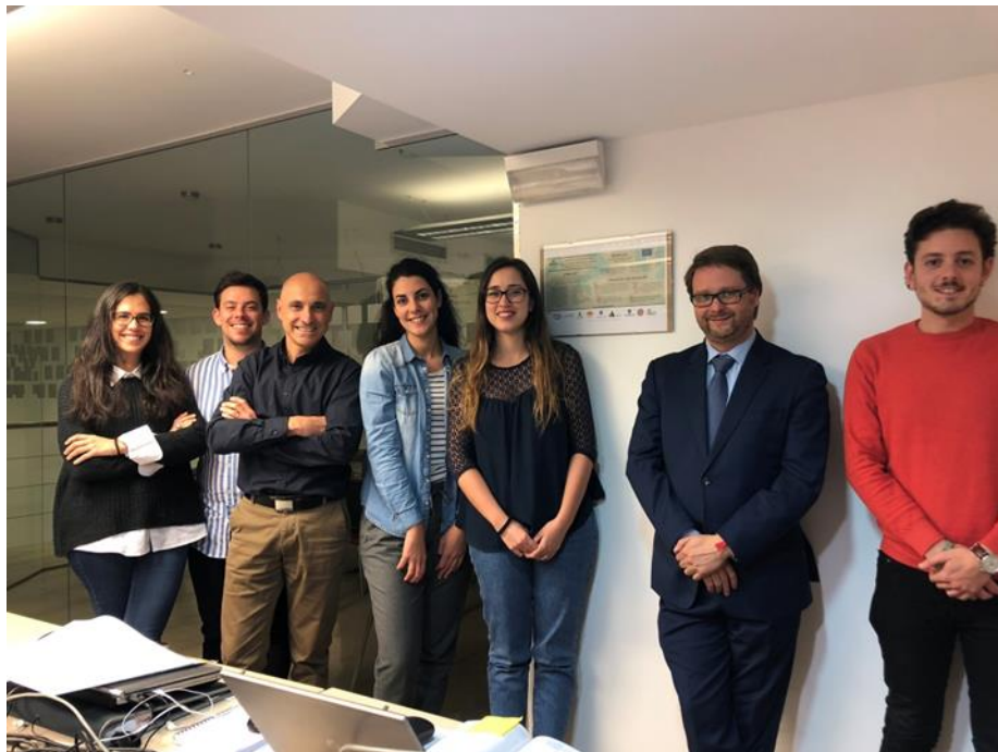
Figure 6. Notice board at Agrifood