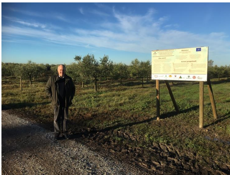
Figure 15. Large information boards at La traversagna, Pisa, Toscana- Italy, led by Salov