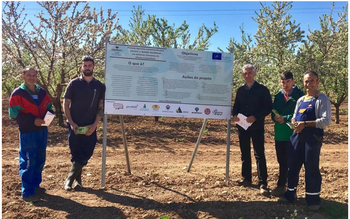
Figure 16. Large information boards at Alandroal, Évora-Portugal, led by Herdade de Charqueirao-SAHC