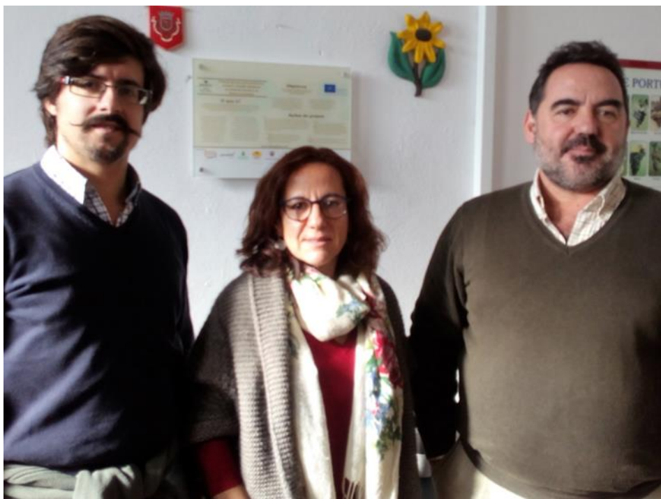
Figure 9. Notice board at Nutriprado