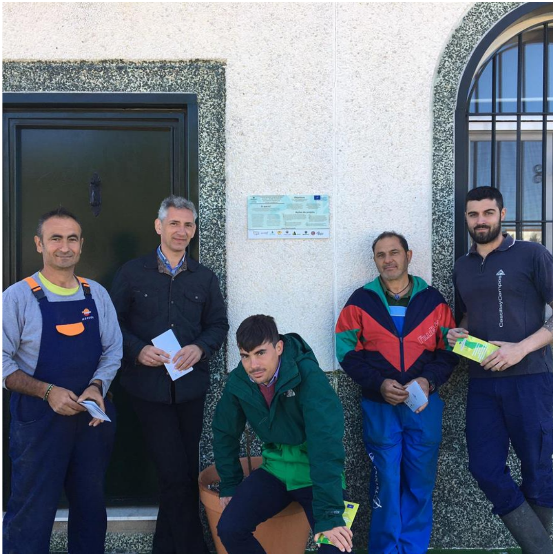
Figure 13. Notice board at SAHC