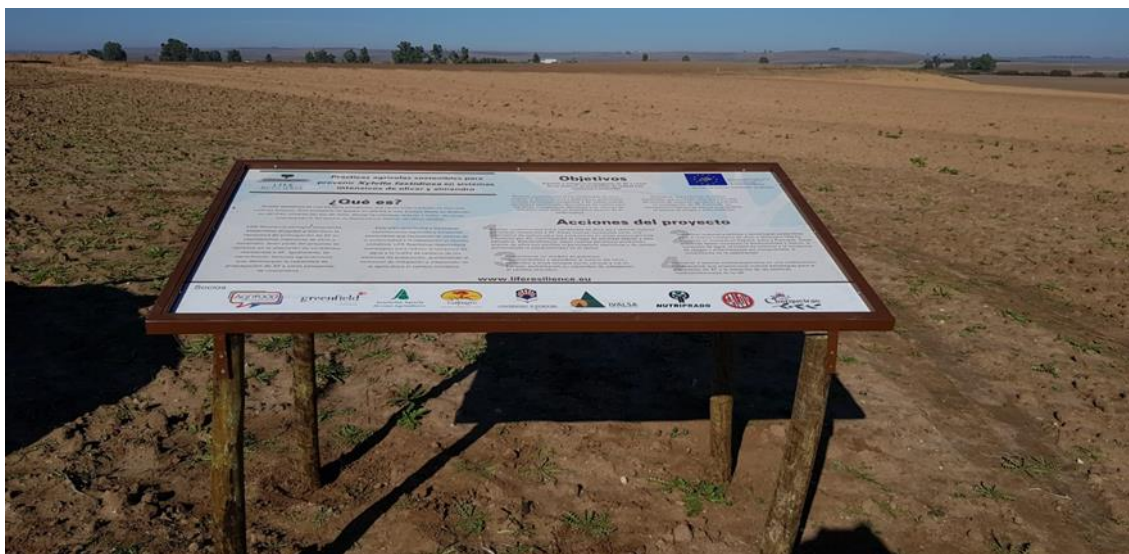
Figure 14. Large information boards at El Valenciano, Carmona, Sevilla-Spain, led by Galpagro