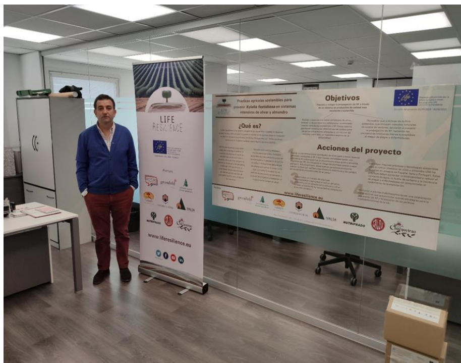
Figure 10. Notice board at ASAJA Madrid